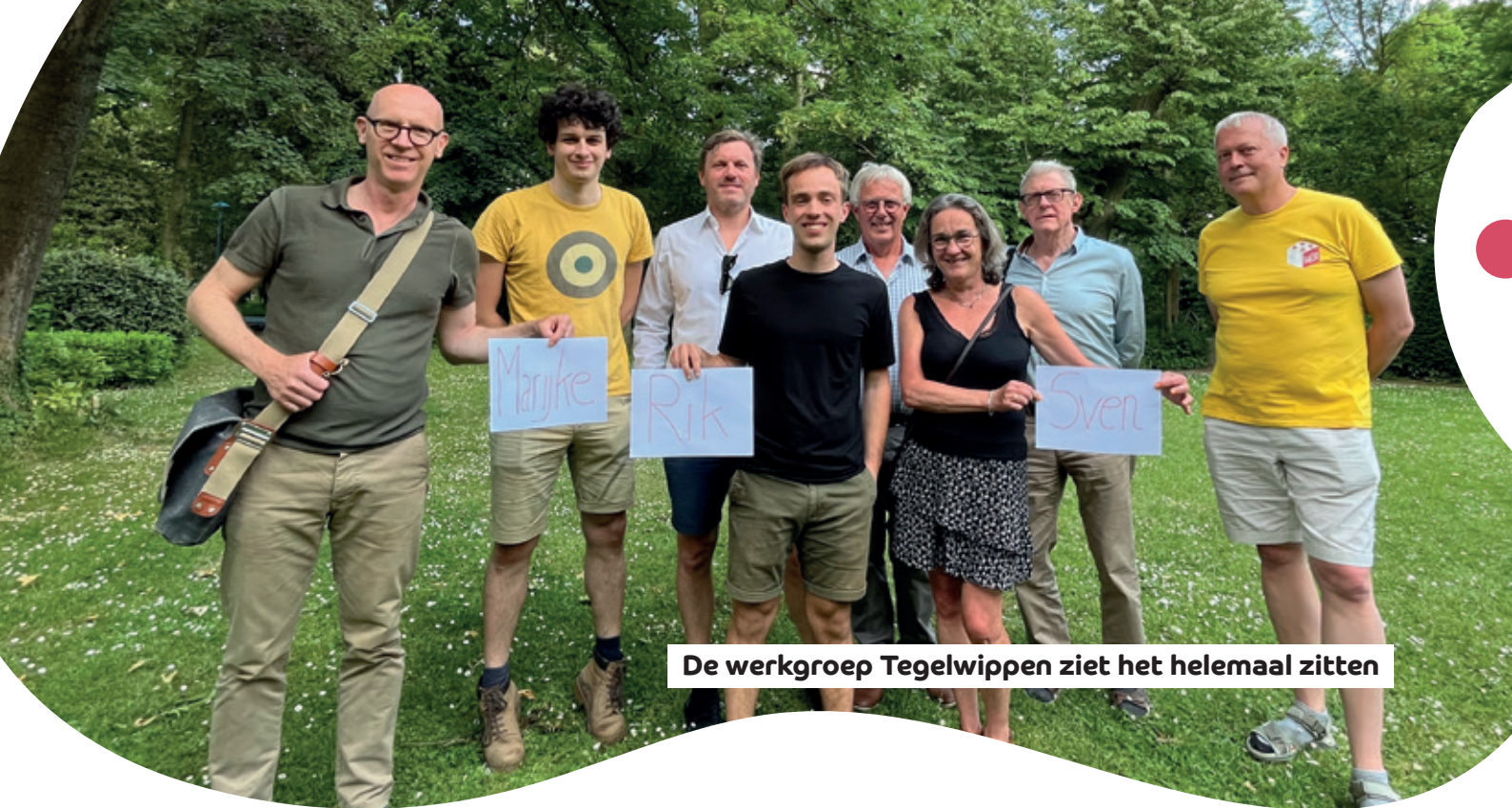
De werkgroep Tegelwippen ziet het helemaal zitten