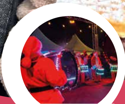
Kerst in Lauwe