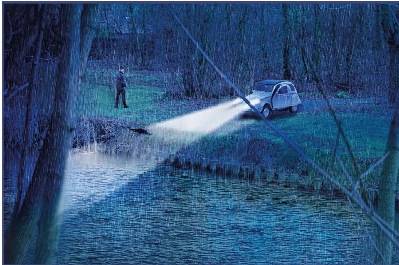
De afdeling fotokunst van de Stedelijke Academie Beeldende Kunst publiceert maandelijks een beeld opgenomen in of rond Menen. Beeld uit fotokunstmagazine "I'Am selling this Wedding Ring I no longer need." Fotomagazine kan je bestellen via www.academiemenen.be