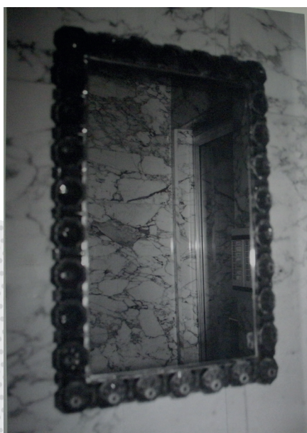
Kunstwerk in het stadhuis, S.N.-N.M.-08 van Dirk Braeckman